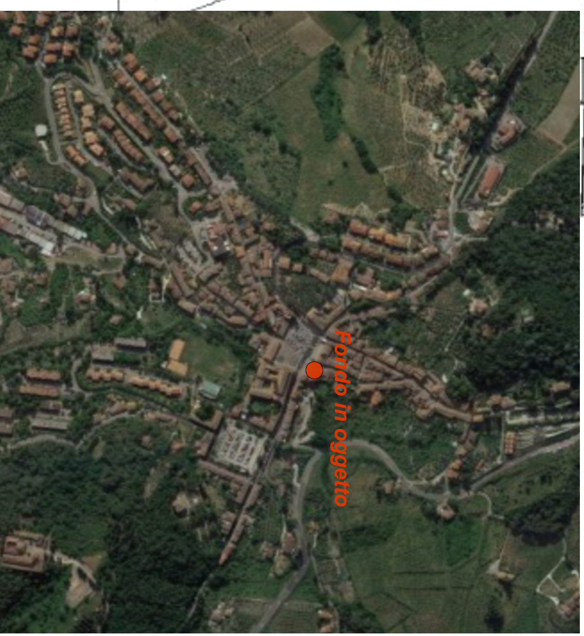
Fondo in oggetto